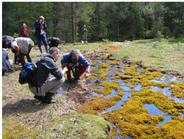
Participants au séminaire de Persåsen visitant un exemplaire typique de l'habitat « 7220 Sources pétrifiantes avec formation de tuf (Cratoneurion) »