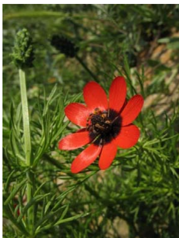
Adonis annua , l'une des quelques 50 000 images disponibles auprès de la Fondation Saxifraga

La Fondation Saxifraga est un réseau de plus de 100 photographes naturalistes issus de 17 pays européens, associés au European Centre for Nature Conservation , avec pour objectif de stimuler et faciliter la conservation de la biodiversité européenne par la mise à disposition, à titre gracieux, de photos de haute qualité. Les photos peuvent être consultées et téléchargées sur Saxifraga .