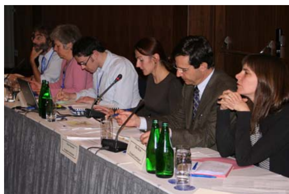
Le CTE/DB (à gauche) et la Commission Européenne (à droite) durant la réunion de Sopot

Des informations complémentaires sur Natura 2000, y compris des statistiques régulièrement mises à jour, sont disponibles sur le site du CTE/BD .