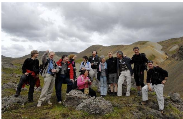
L'équipe de coordination SEBI en Islande

Deux réunions de l'équipe de coordination SEBI ont eu lieu, d'abord à Reykjavik (3 - 4 Juillet) accueillie par l'Institut islandais d'histoire naturelle puis à Copenhague, (30 - 31 octobre) pour faire le point sur les travaux des trois groupes de travail et pour valider la structure du rapport AEE d'évaluation basé sur des indicateurs en 2009.